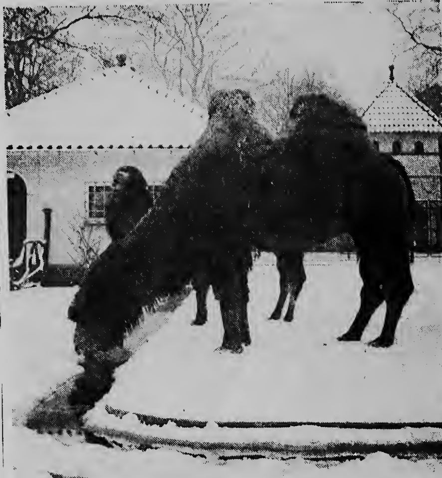
E dromedarisan den Artis ta hanja e sneeuw algo poco stranjo. Tambe den Amsterdam hopi sneeuw a cai den e ultimo dianan aki.